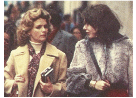
1975 RACOLAGE (Hustling) de Joseph Sargent avec Jill Clayburgh