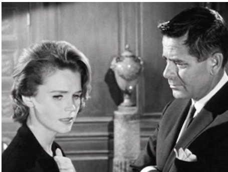
1961 ALLÔ BRIGADE SPÉCIALE (Experiment in Terror) de Blake Edwards avec Glenn Ford