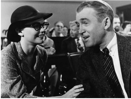
1959 AUTOPSIE D'UN MEURTRE (Anatomy of a Murder) d'Otto Preminger avec James Stewart