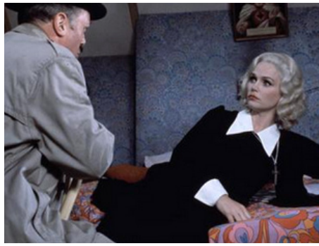
1970 LE MAGOT (Loot) de Silvio Narizzano avec Richard Attenborough