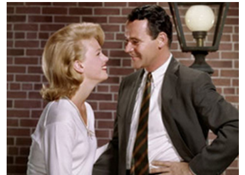
1962 LE JOUR DU VIN ET DES ROSES (Days of Wine and Roses) de Blake Edwards avec Jack Lemmon