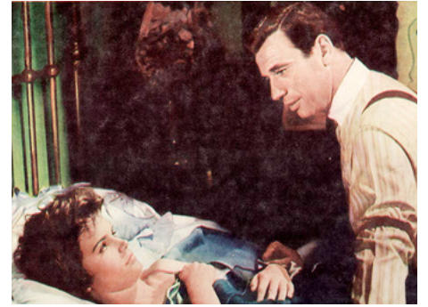
1960 SANCTUAIRE (Sanctuary) de Tony Richardson avec Yves Montand