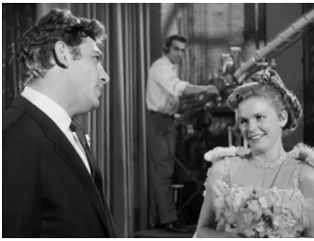
1957 UN HOMME DANS LA FOULE (A Face in the Crowd) d'Elia Kazan avec Andy Griffith