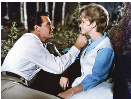
1963 LITS SÉPARÉS (The Wheeler Dealers) d'Arthur Hiller avec James Garner