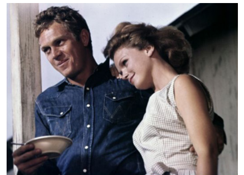
1964 LE SILLAGE DE LA VIOLENCE (Baby the Rain must fall) de Robert Mulligan avec Steve McQueen