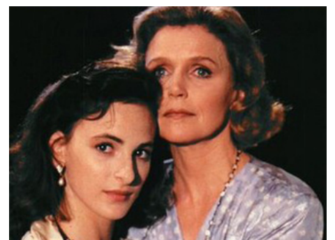
1989 POUR L'AMOUR DE LISA (Bridge to Silence) de Karen Arthur avec Marlee Matlin