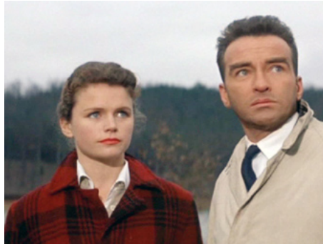
1959 LE FLEUVE SAUVAGE (Wild River) d'Elia Kazan avec Montgomery Clift