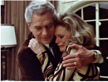
1972 A DELICATE BALANCE de Tony Richardson avec Paul Scofield