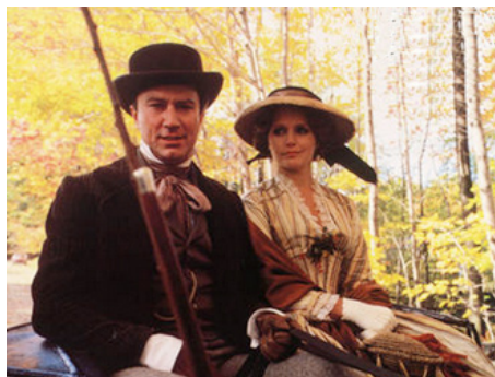
1979 LES EUROPÉENS (The Europeans) de James Ivory avec Robin Ellis