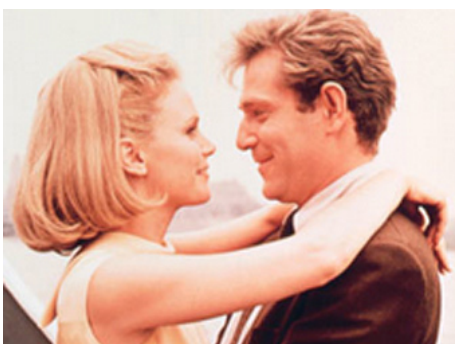
1967 LE REFROIDISSEUR DE FEMMES (No Way to treat a Lady) de Jack Smight avec George Segal