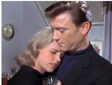
1962 LE DEUXIÈME HOMME (The running Man) de Carol Reed avec Laurence Harvey