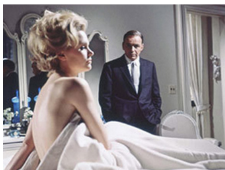
1968 LE DÉTECTIVE (The Detective) de Gordon Douglas avec Frank Sinatra