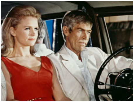
1969 CET HOMME EST PRÊT À TOUT (Hard Contract) de S. Lee Pogostin avec James Coburn