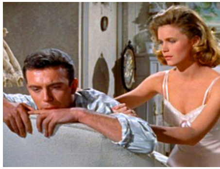
1958 LES FEUX DE L'ÉTÉ (The long hot Summer) de Martin Ritt avec Anthony Franciosa