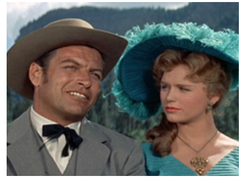
1958 DUEL DANS LA BOUE (These thousand Hills) de Richard Fleischer avec Richard Egan