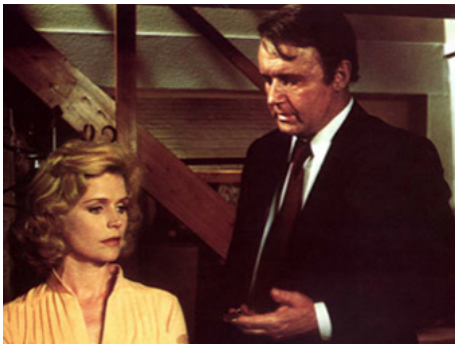
1975 LE GRAND DÉFI (Hennessy) de Don Sharp avec Rod Steiger