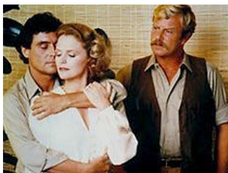
1982 LA LETTRE (The Letter) de John Erman avec Ian McShane, Jack Thompson