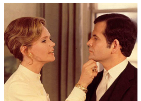
1969 UNE TÊTE COUPÉE (A severed Head) de Dick Clement avec Ian Holm