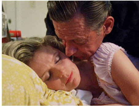
1974 THE BLUE KNIGHT de Robert Butler avec William Holden