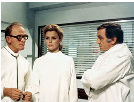
1977 LA GRANDE MENACE (The Medusa Touch) de Jack Gold avec Gordon Jackson, Lino Ventura