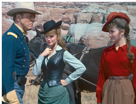
1964 SUR LA PISTE DE LA GRANDE CARAVANE (The Hallelujah Trail) de J. Sturges avec B. Lancaster, P. Tiffin