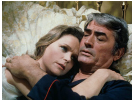
1976 LA MALÉDICTION (The Omen) de Richard Donner avec Gregory Peck