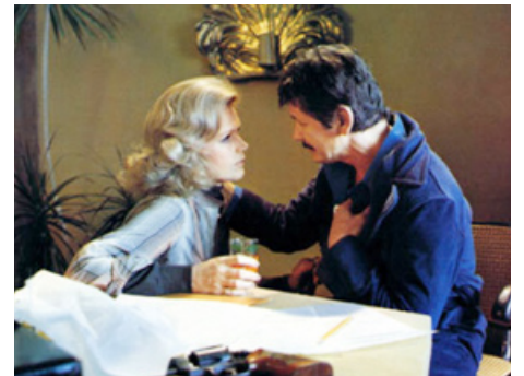
1977 UN ESPION DE TROP (Telefon) de Don Siegel avec Charles Bronson