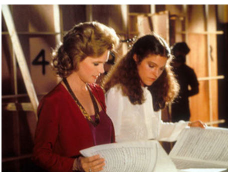
1980 LE CONCOURS (The Competition) de Joel Oliansky avec Amy Irving