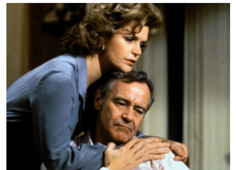
1980 UN FILS POUR L'ÉTÉ (Tribute) de Bob Clark avec Robby Benson